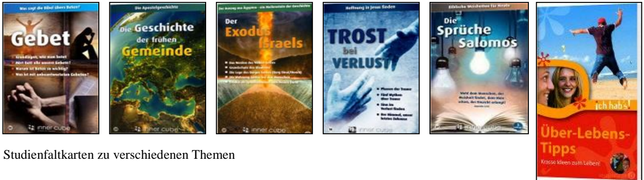
Studienfaltkarten zu verschiedenen Themen

Kostengünstige Fremdangebote – zu finden unter www.auc-online.net Geordert für den Unterricht, Distanzunterricht und Heimbeschäftigung